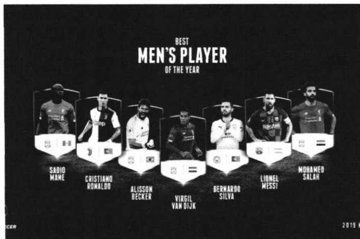
Globe Soccer indicados

O Globe Soccer também aponta a revelação do ano, e a lista traz promessas que já vêm se destacando no futebol europeu. Os cinco indicados