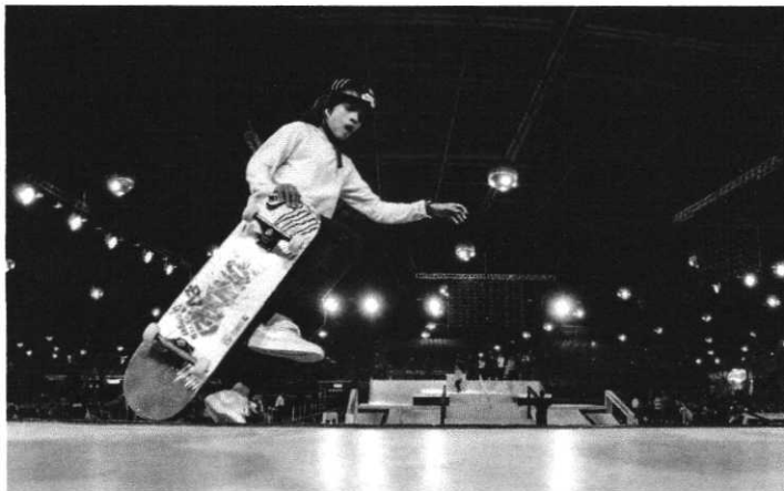
Rayssa Leal, a Fadinha, é promessa de medalha do Brasil, em Tóquio 2020

-Vamos fazer a recuperação do piso das rampas, tivemos até a preocupação de conversar com o pai da Rayssa para entrar em contato com a Confederação Brasileira de Skate para que a gente também possa fazer obstáculos que ela possa treinar e que também incentive a formação de novos atletas aqui na nossa cidade. A gente tem essa preocupação de ter obstáculos como por exemplo o corrimão na altura, para que o atleta