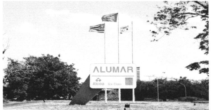
Fachada da entrada da Alumar

O Maranhão viu sua economia ganhar um novo impulso com a instalação da Alumar