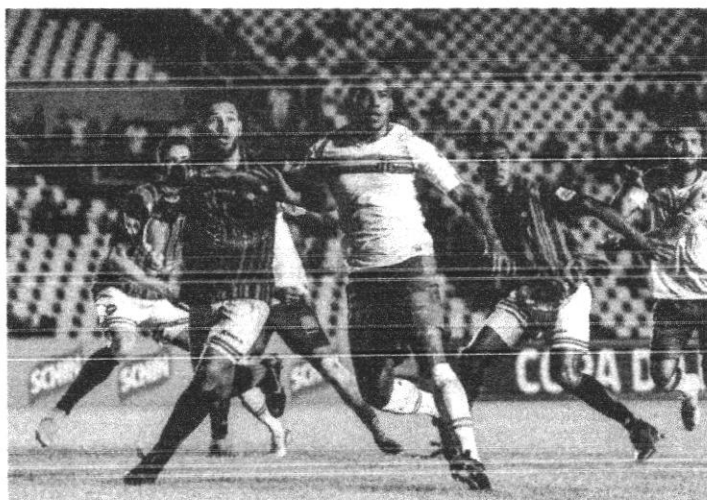
Superclássico só vai acontecer em março

Outro jogo que também teve adiamento foi o duelo entre Moto e Cordino, pela quarta rodada da competição. O que aconteceria no dia 20 de fevereiro passou para primeiro de março, ainda no Castelão, mas como novo horário, de 16h30 para 20h. A FMF informou que a mudança é por conta de "adequação da tabela para realização da partida em fim