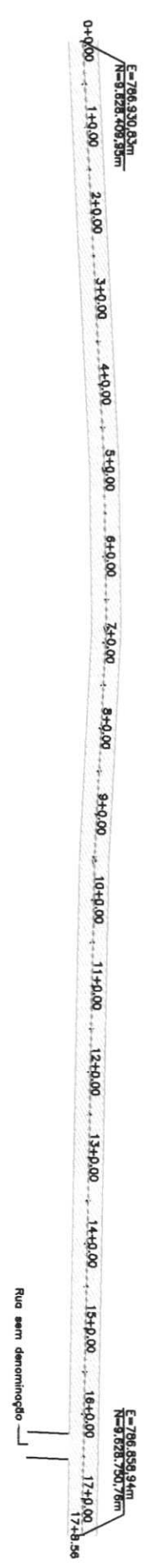
D/1 TRAÇADO HORIZONTAL Escala: 1/1000

CARACTERÍSTICAS COMPRIMENTO = 348,56m LARGURA = 7,00m ÁREA = 2.439,92m²