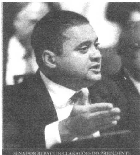
SENADOR REBATE DECLARAÇÕES DO PRESIDENTE

"É preciso mostrar a verdade e o trabalho que os governadores do Nordeste estão fazendo pela educação, ao contrário do que diz o presidente Bolsonaro. Temos escolas públicas civis e militares alcançando ótimos índices no Maranhão. O Nordeste é exemplo para todo o Brasil na área de educação. A questão é que, independentemente do modelo, há na região, um grande esforço para promover uma educação de qualidade e recuperar o déficit histórico que