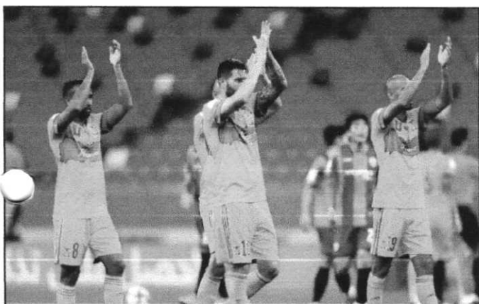
O Tigres não teve uma boa atuação, mas conseguiu a virada e a classificação

Mesmo com atuação ruim, time mexicano consegue vitória de virada e garante vaga na semifinal. Confronto no próximo domingo