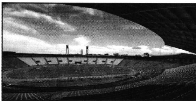
TRICOLOR FAZ SUA ÚLTIMA PARTIDA EM SÃO LUÍS PELA SÉRIE B DIANTE DO CRUZEIRO, NO CASTELÃO

Diante dos mineiros, o jogo do Sampaio foi agendado para o dia 19 de novembro, sexta-feira, às 21h30, no Castelão. Já a partida da última rodada contra o Avaí obedecerá a simultaneidade de jogos e será no domingo, dia 28 de novembro, às 16h, na Ressacada.