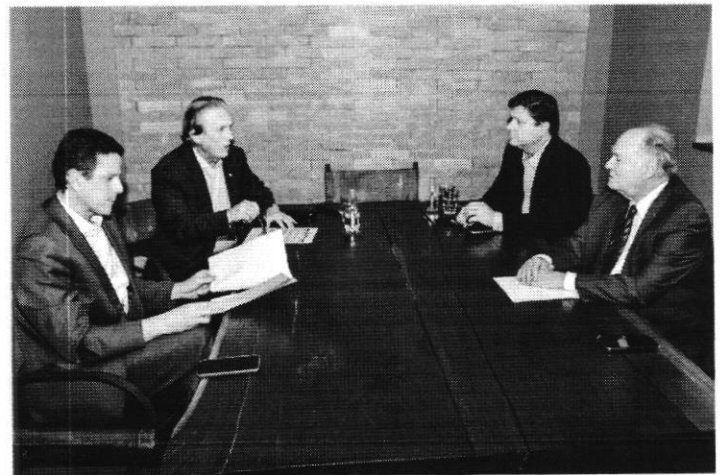
PRESIDENTES DE PSDB, UNIÃO BRASIL, MDB E CIDADANIA VÃO ANUNCIAR CANDIDATO ÚNICO

O deputado, que é ventilado como nome a ser oferecido pelo União Brasil, disse que posição em pesquisas, capilaridade, receptividade e rejeição dos postulantes devem ser os