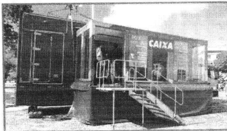
MAIS DE 80% PODEM LIQUIDAR SEUS DÉBITOS POR ATÉ R$ 1000

“Temos buscado aprofundar cada vez mais a nossa atuação para que o brasileiro tenha o nome limpo. Desde 2017 a Caixa faz a campanha de recuperação de crédito, estimulando aqueles que quiserem quitar à vista qualquer tipo de modalidade de crédito, exceto habitação e agro”, afirmou a presidente