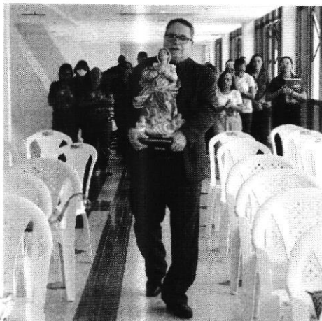
Imagem de Nossa Senhora da Conceição é recebida no Fórum de São Luís